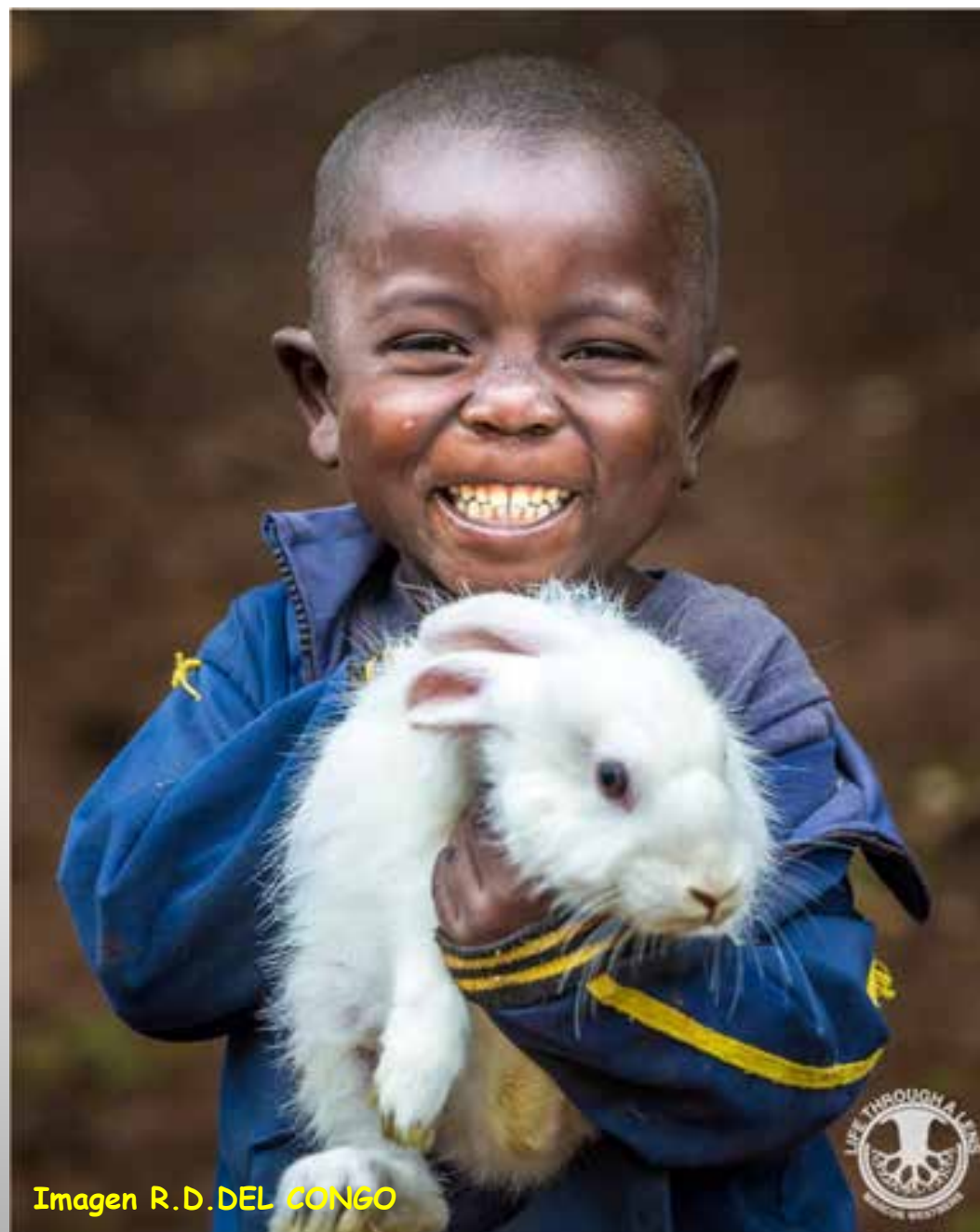
Imagen R.D. DEL CONGO