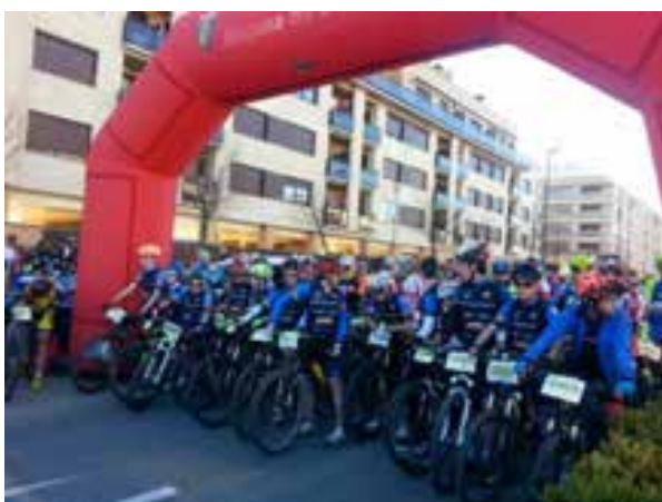
Distintos momentos de la BTT 2016: corredores, voluntarios, puestos de avitallamiento, Palacio de los Deportes...