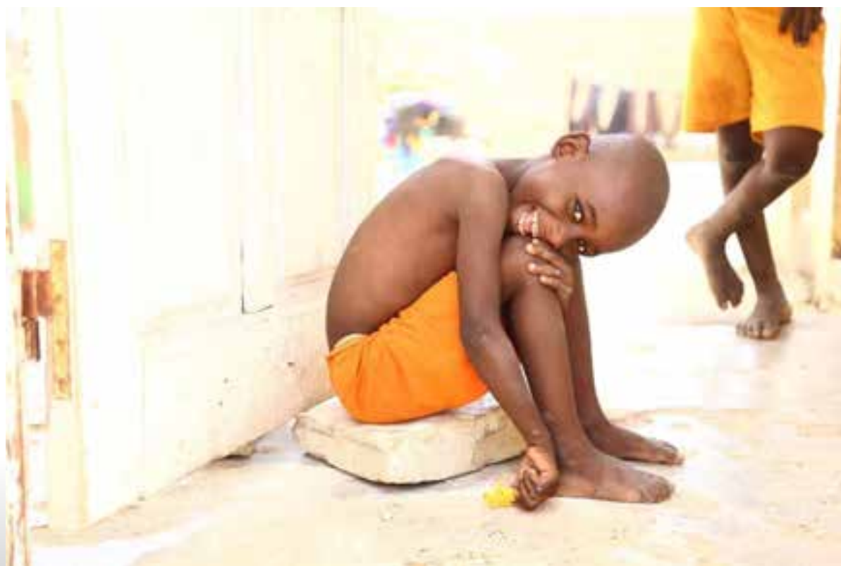
Imagen de portada: Senegal