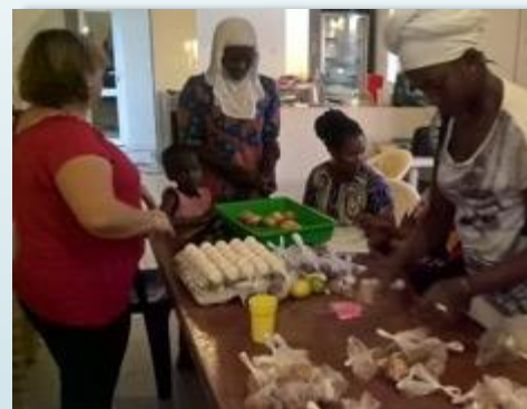
Talleres culinarios con las mujeres