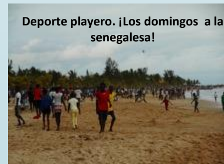
Deporte playero. ¡Los domingos a la senegalesa!

Además de todos estos proyectos, siempre surgen cosas nuevas que hacer y aprender. Estamos en África y hay que dejar espacio para la improvisación ¡Déjate llevar!