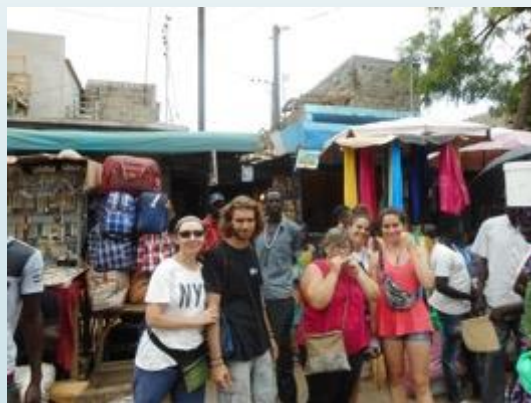
Visitamos los mercados locales