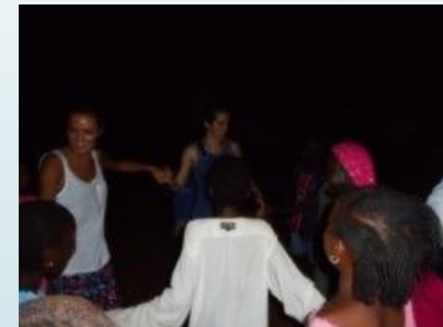
Bailes locales, déjate llevar

Además de todos estos proyectos, siempre surgen cosas nuevas que hacer y aprender. Estamos en África y hay que dejar espacio para la improvisación ¡Déjate llevar!