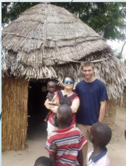
Visitando poblado SERER 2015

Visitaremos los mercados locales como el de Mbour donde se compran telas senegalesas, el mercado del pescado 'impresionante'; poblados donde aprenderemos a moler mijo, sacar agua de un pozo o, simplemente, disfrutar de una tarde con ellos a la sombra de un Baobab. Y también habrá algún día de descanso playero.