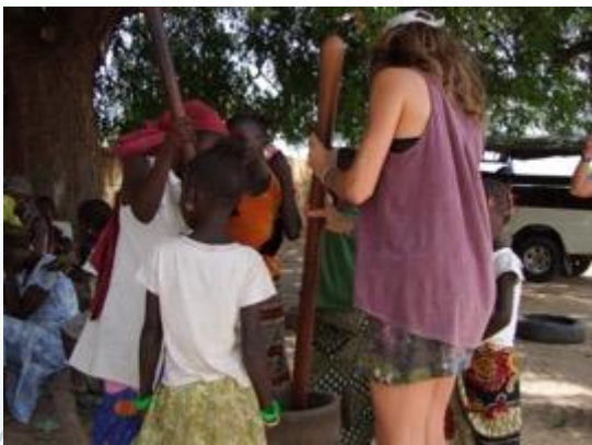
Aprendiendo a moler mijo, 2016

Además del trabajo de re habilitación y talleres con los jóvenes y niños de la zona, organizaremos actividades con las madres y mujeres de la asociación local para aprender a hacer jabones, mermeladas, teñir telas.. Y nosotros podemos enseñar lo que sepamos.