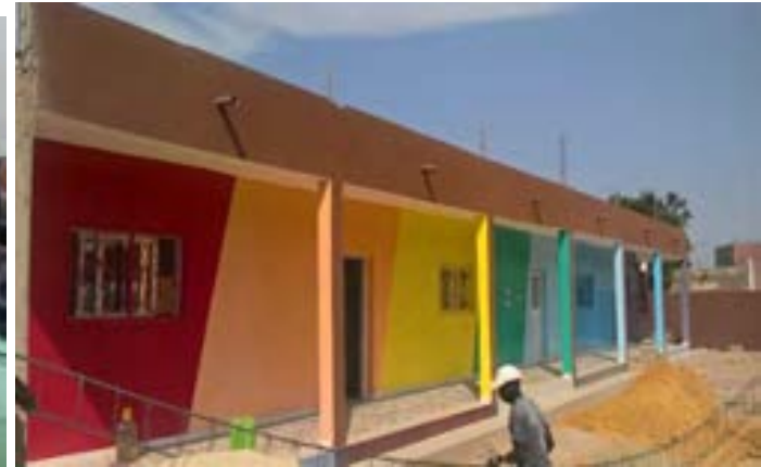
Actividad en la guardería 'Arc en Ciel'. Detalle del edificio en el final de las obras.

El proyecto ha consistido en la creación de un centro educativo de bebés y preescolar para niños y niñas de Saly Vélingara, con edades entre 2 y 6 años, con profesoras profesionales. Al mismo tiempo se implementan iniciativas productivas entre las madres y mujeres del poblado cuyos beneficios contribuyan a la sostenibilidad de esa escuela. Es un proyecto de apoyo a la educación básica, con marcado enfoque de género y sostenible gracias a la participación de madres y mujeres en actividades generadoras de ingresos.