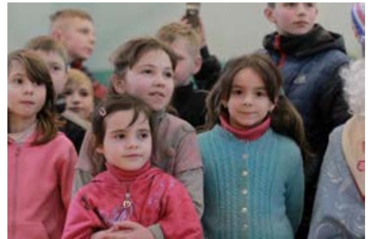
Niños del programa SOS Ucrania durante su estancia en Barcelona y en el orfanato en el que residen.