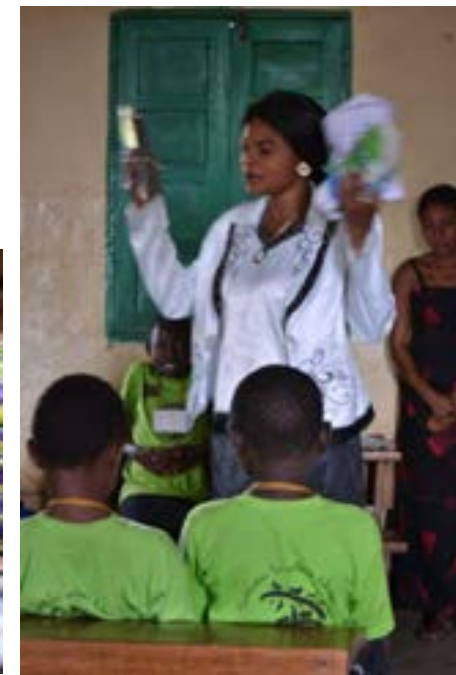
Distintos momentos de la terapia grupal con las niñas víctimas de violencia

En 2016 Coopera ha continuado con este programa especializado en víctimas de violencia sexual dirigido a menores de entre 2 y 17 años, que comenzó en 2014. El programa incluye el seguimiento médico en las zonas donde habitan las víctimas hasta un año después del incidente. Para ello contamos con la colaboración del Hospital y la Fundación Panzi. En el marco del programa, las menores afectadas son incluidas en Terapias Grupales Psicológicas con niñas de su misma edad, mientras que la familia de la afectada también es atendida en un programa apoyo psicosocial. Otras medidas que incluye el programa de Coopera es el derecho a la escolarización o formación profesional durante un mínimo de tres años y al apoyo jurídico gratuito gracias a la colaboración de la Policía Nacional de Congo, asociaciones locales y los Departamentos Jurídicos de Panzi y Naciones Unidas. Al mismo tiempo que se atiende a las víctimas, se realizan programas de prevención y sensibilización en las zonas y entre las comunidades donde son agredidas.