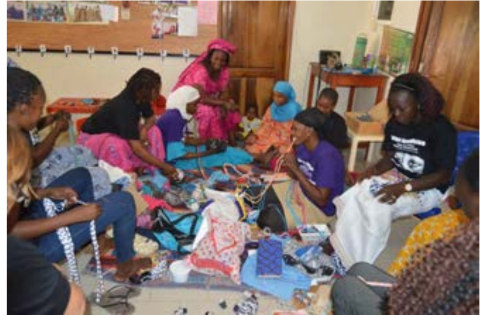
En las imágenes: mujeres de Saly preparando el microhuerto. Mermelada de mango. Talleres de costura