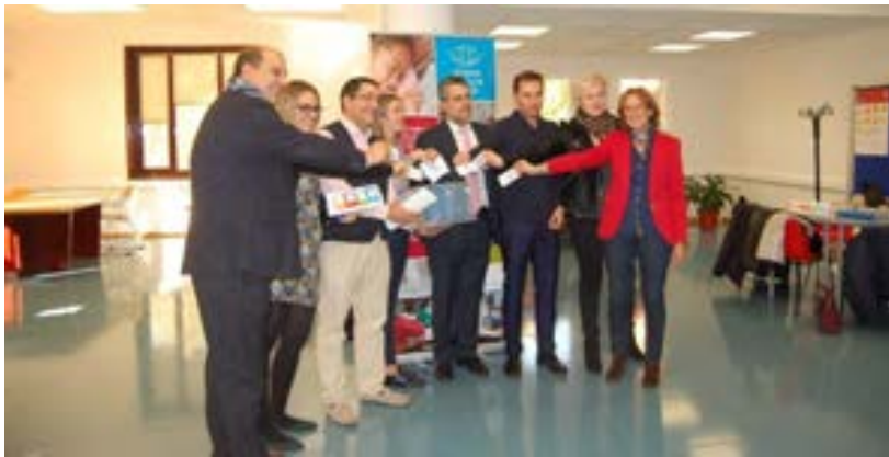
Imágenes de la última campaña celebrada en 2016

Beneficiarios directos: 66.297 estudiantes