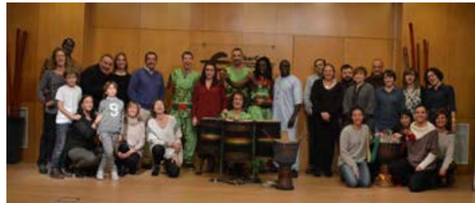
Foto de familia con el grupo Afrika Lion que clausuró las jornadas.