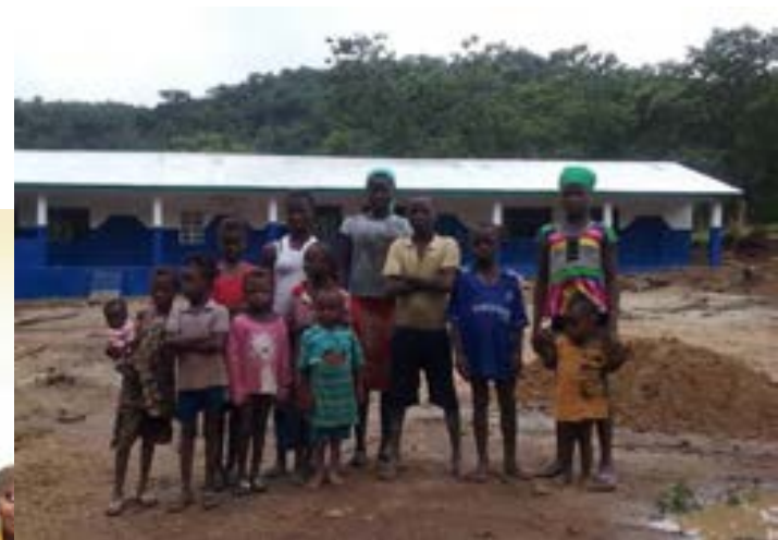
De izquierda a derecha: Escuela Bafodia, niños en la escuela Kakondobi y Tonkoya

En 2016 Coopera ha continuado con el proyecto Wara Wara en el marco del cual se están construyendo escuelas y ayudando a los maestros a conseguir una mejor formación. Este año 55 maestros comunitarios pudieron completar 3 años en la universidad estando ya titulados y se han construido las siguientes escuelas: