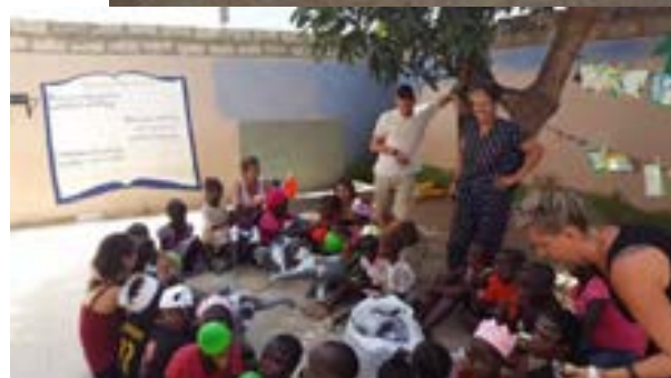
Imágenes de voluntarios en la granja La Ferme, la guardería 'Arc en Ciel' y en otras actividades, en Senegal en 2016