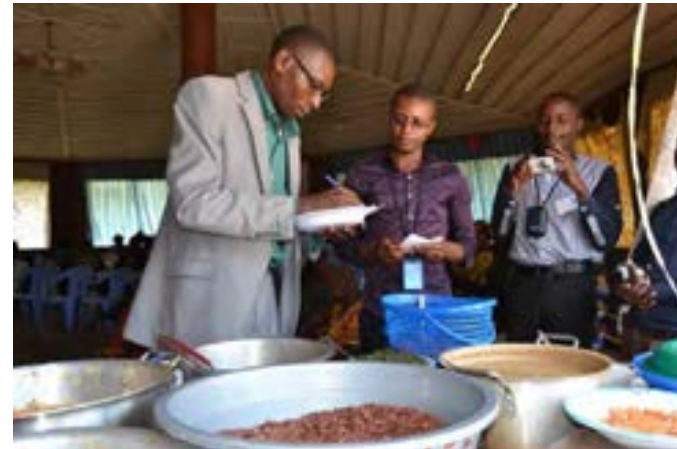
Distintas imágenes de la celebración