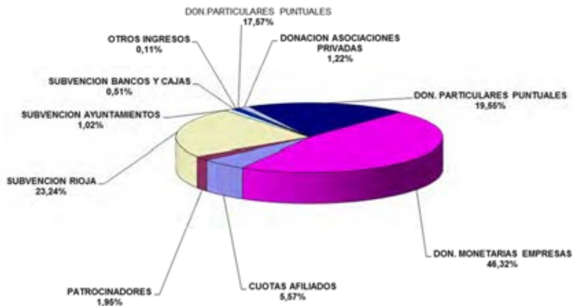
PROCEDENCIA DE LA FINANCIACION 2016