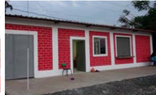
Imagen de la escuela antes del terremoto y del estado actual tras los trabajos de reconstrucción.

En 2016 hemos ejecutado la reconstrucción de una de las escuelas de Manabí que quedó muy afectada por el terremoto de Ecuador. El Colegio Sagrada Familia es un centro educativo de primaria y secundaria dirigido por las Siervas del Hogar de la Madre, que da formación humana y religiosa a más de cuatrocientos niños del lugar. En el terremoto del 16 de abril, después de una semana de lluvias torrenciales e inundaciones en Playa Prieta, se desplomó el edificio principal del colegio, que quedó totalmente destruido con todo lo que tenía dentro.