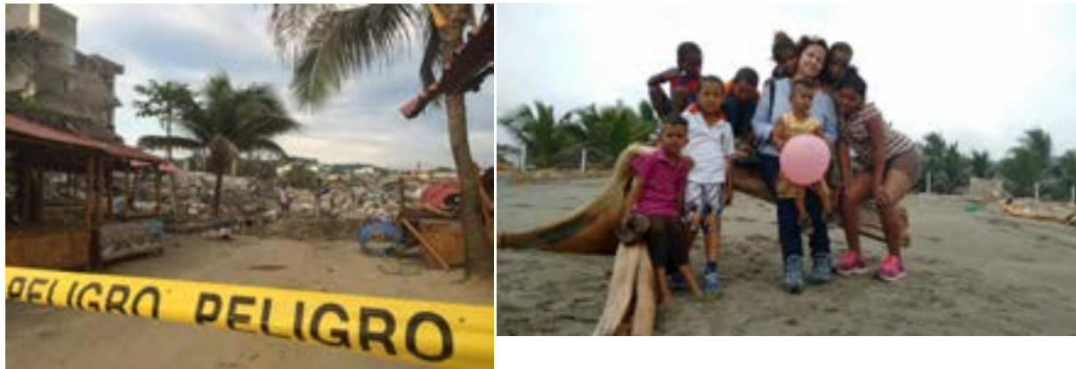
Imágenes de la zona más afectada de Ecuador por el Terremoto de 7,8 en la escala Richter.

La ONGD Coopera, con presencia en Ecuador desde hace años, respondió al llamamiento de ayuda de emergencia lanzado por del Gobierno Provincial de Manabí, tras el terremoto del pasado mes de abril, uno de los de mayor intensidad de los últimos 20 años en América Latina.