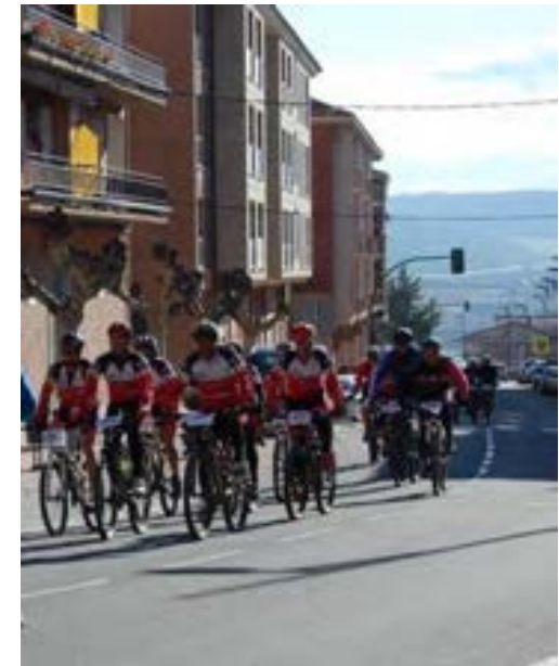
Distintos momentos de la BTT 2015: corredores, voluntarios, puestos de avituallamiento, Palacio de los Deportes...