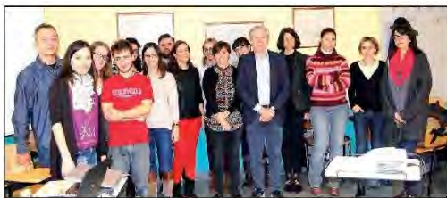
Foto del día, durante la clausura de la II Escuela de Cooperación, promovida por la ONG Coopera, en